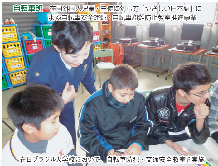
自転車班 在日外国人児童・生徒に対して「やさしい日本語」による自転車安全運転・自転車盗難防止教室推進事業