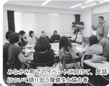
みなかみ町でのイベントに向けて、民話について語り合う履修生と協力者