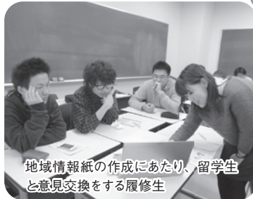
地域情報紙の作成にあたり、留学生と意見交換をする履修生